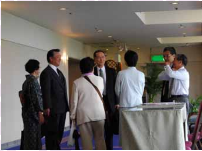
小林先生と七十二歳の恩師に 六十一歳の支部長、先生若い！