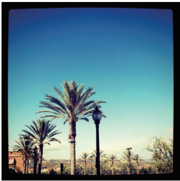
アメリカアーバインの風景

私はカリフォルニア州の南にあるオレンジカウンティはアーバイン、という街に住んでいます。片仮名で書くとそれっぽく見えますが、オレンジカウンティ=オレンジ郡、です。南秋田郡と何ら変わりません。ロスアンゼルスから車で40分位南に位置している新興住宅街で、治安もアメリカの都市の中では一、二を争う良さで知られています。常に温暖で、冬にちょっと涼しくなる位なので、季節感が狂います。