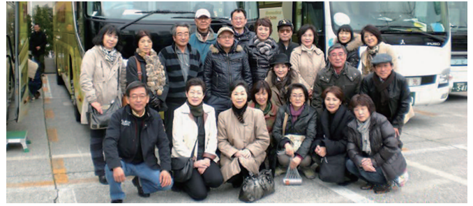
バスの前で記念写真

さてお待ち兼ねの昼食は「すしざんまい」、ビールで乾杯！お鮓を13貫も食べ、小鉢・茶碗蒸しも付き、お腹一杯！満足満足！