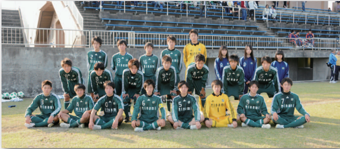
今年卒業の三年生勢ぞろい