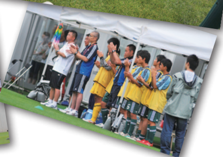
4枚の写真は北東北インターハイより